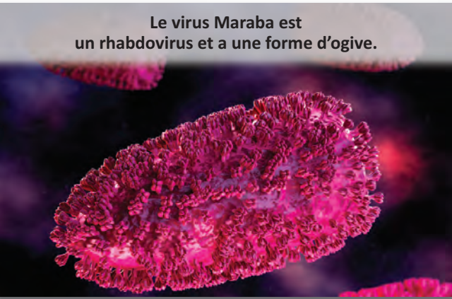
Le virus Maraba est un rhabdovirus et a une forme d'ogive.

Vous aidez à financer la recherche locale à partir de laquelle de nouvelles thérapies sont élaborées qui, à leur tour, progressent par l'entremise d'essais cliniques. Grâce au solide appui de notre communauté, Ottawa s'est démarquée à titre de centre d'excellence pour la recherche et les essais cliniques, alors que la ville est souvent choisie en premier afin de mettre en place de nouveaux essais cliniques. Vous avez aidé à donner accès à plus de 1 500 patients locaux atteints du cancer à de possibles traitements salvateurs chaque année par l'entremise d'essais cliniques. Avec plus de 200 essais cliniques se déroulant au sein de notre communauté et jusqu'à 40 nouveaux essais entamés chaque année, la force de notre programme d'essais cliniques est vitale pour les patients et les chercheurs. Vous avez également aidé à lancer des essais cliniques au Centre de cancérologie Famille Irving à l'Hôpital Queensway Carleton. De plus, votre soutien des essais cliniques locaux aide à générer de 4 à 5 millions de dollars en investissements dans les médicaments spécialisés qui, autrement, ne seraient pas offerts aux patients.